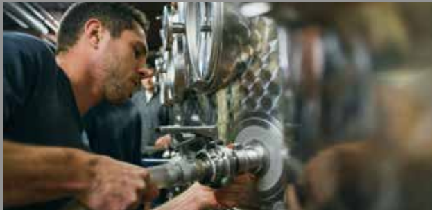
Bild oben, innen rechts und links: © Hessen schafft Wissen / Steffen Boettcher